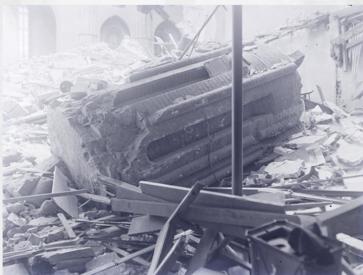
Photographie de l'effondrement du clocher de la Dalbade, Toulouse, 14 avril 1926