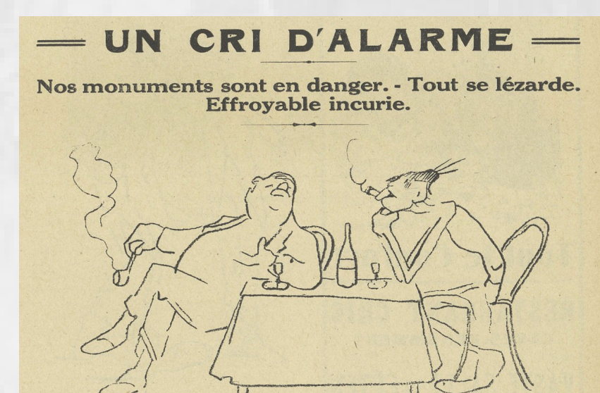
Extrait d'un article du Cri de Toulouse, page, avril 1926

Un manque d'entretien semble toucher les monuments toulousains.