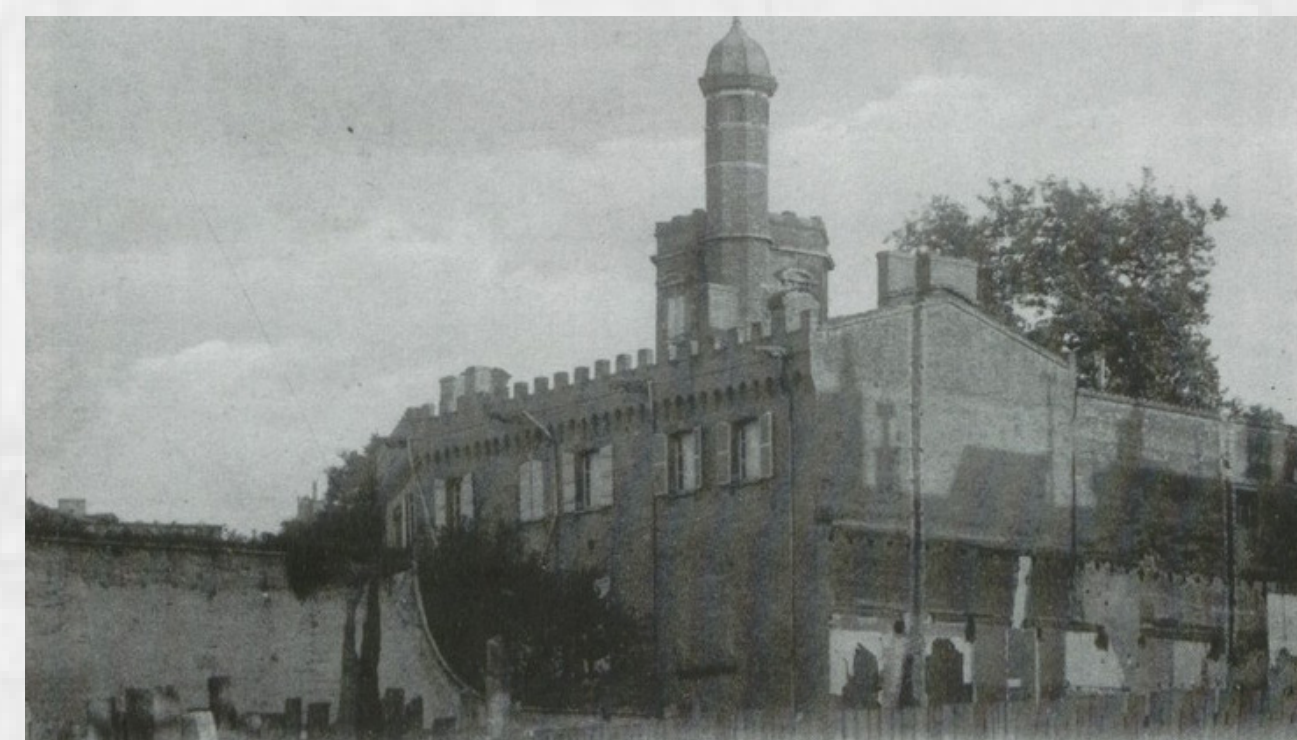
Photographie de l'hôtel d'Aussargues partiellement détruit, Toulouse, 1908

Le percement de la rue Ozanne et la question de la destruction de l'hôtel d'Aussargues.